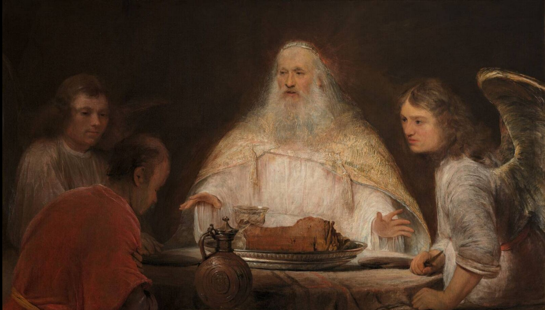
Les Fils d'Abraham